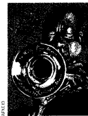
Geoff Dyer, Κι όμως, όμορφο... Ένα βιβλίο για την Τζαζ. Μετ. Δανάη Στεφάνου, Πάπυρος, σελ. 296

«Το μόνο βιβλίο για την τζαζ που έχω συστήσει στους φίλους μου» έχει γράψει ο διάσημος Κιθ Τζάρρετ για το «Κι όμως, όμορφο... Ένα βιβλίο για την τζαζ» του Λονδρέζου Τζεφ Ντάιερ (Geoff Dyer, γενν. το 1958), τακτικού συνεργάτη της Guardian, του Independent, του New Statesman, του Esquire κ.ά. Το βιβλίο εκδόθηκε το 1991 αποσπώντας το Somerset Maugham Award και θεωρείται ένα από τα σύγχρονα «κλασικά» βιβλία γύρω από την τζαζ. Να πούμε πρώτα κάτι για τον τίτλο του βιβλίου: «But Beautiful»: ένα από τα standard τραγούδια που ανήκουν στην ευρεία οικογένεια του λεγόμενου American Songbook. Η σύνθεση είναι του Jimmy Van Heusen, οι στίχοι του Johnny Burke. Το ερμηνεύσε πρώτος ο Μπινγκ Κρόσμπι το 1947, στην ταινία «Road to Rio» και από τότε το έχουν ερμηνεύσει μεγάλοι jazzmen, όπως οι σαξοφωνιστές Μπεν Ουέμπερ, Άρτ Πέπερ (οι οποίοι αναφέρονται στο βιβλίο του Ντάιερ), ο μεγάλος πιανίστας Μπιλ Εβανς (που δυστυχώς δεν αναφέρεται) κ.ά. Ένα βιβλίο ιδιαίτερο. Ένα σύνολο αφηγήσεων που θα μπορούσαν να είναι μυθολογία αλλά δεν είναι: όλα τα κείμενα βασίζονται σε πραγματικές ιστορίες μουσικών της τζαζ. Είναι όμως γραμμένα σαν να ήταν μυθολογία. Το «Κι όμως, όμορφο» είναι ένα χαρακτηριστικό δείγμα αυτού που στον αγγλόφωνο χώρο χαρακτηρίζεται ως non-fiction novel: αφηγήσεις που δεν είναι με αποτέλεσμα επιπόνηση, η όλη τους αφηγηματική τεχνολογία όμως διαρθρώνεται με βάση τις συμβάσεις της λογοτεχνίας. Συνήθως, τέτοια κείμενα συνδυάζουν τη δημοσιογραφική έρευνα, το δοκίμιο, τη βιογραφία, την κριτική.