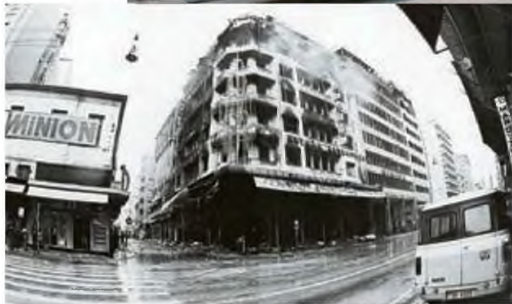
Στις συνθήκες που οδήγησαν στον εμπρησμό του «Μινιόν» και στα πρόσωπα που πρωταγωνίστησαν σε αυτόν αναφέρεται το νέο βιβλίο του Μίμη Ανδρουλάκη με τίτλο «Μαύρο Φως»

μετατραπεί σε καταστροφή και εμπρηστή, ο Ανδρουλάκης απαντά πως το έρεβος της ψυχής παραμένει ανεξίτηστο. Μόνο εικασιές μπορεί ένας ψυχολόγος ή συγγραφέας να κάνει για το τι μπορεί να οδήγησε κάποιον στο έγκλημα.