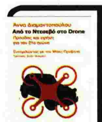
Το εξώφυλλο του νέου βιβλίου της Άννας Διαμαντοπούλου με τίτλο «Από το Ντεσεβό στο drone»

Η Ευρώπη γερνάει και θα είχε όφελος από μια δημογραφική ένεση. Πόσο εύκολη όμως είναι η ενσωμάτωση των μεταναστών στον ευρωπαϊκό τρόπο ζωής; «Σήμερα, σε πολλά αστικά κέντρα σε χώρες της ΕΕ, υπάρχουν πόλεις με άλλες “πόλεις” στο