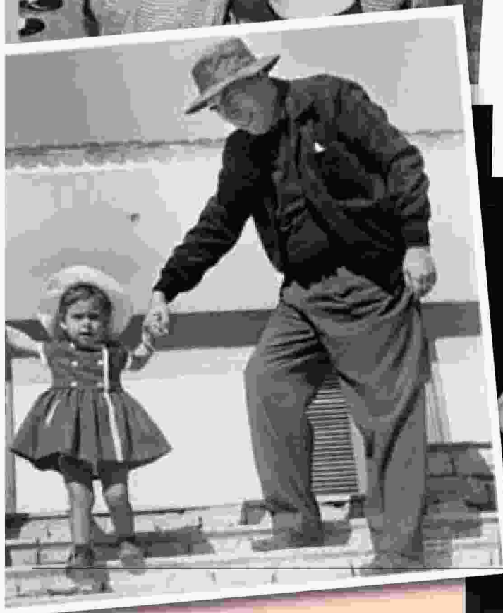
Ηθοποιός πια στον φακό της Nelly's.