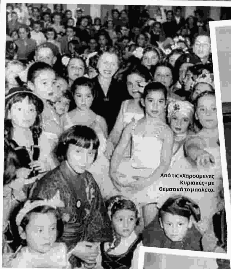
Από τις «Χαρούμενες Κυριακές» με θεματική το μπαλέτο.