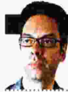
ΓΡΑΦΕΙΟ ΝΙΚΟΣ ΚΟΥΡΜΟΥΛΗΣ

Δεκαεπτά συγγραφείς, δημοσιογράφοι, εκδότες και ο γιος του μιλούν χωρίς φόβο και πάθος για τον άνθρωπο που πρώτος ανέδειξε το αστυνομικό μυθιστόρημα στην Ελλάδα και υπήρξε τέρας παραγωγικότητας αλλά και άτεγκτος κριτής της καλής κοινωνίας